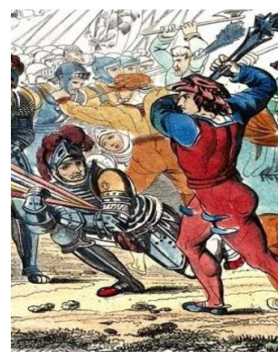
Dessoulement de Winkelried

Ankunft: Um ca.18:00h an Bahnhof Läuelfingen